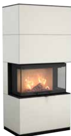
Ci51A, Artstone Bianca, 345 kg