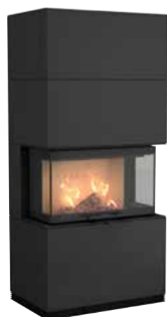
Ci51, Acciaio laccato nero, 230 kg