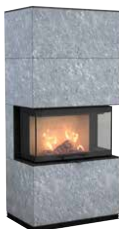
Ci51T, Pietra ollare, 400 kg