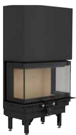
Ci50 160 kg

Contura i51: Vano portalegna in acciaio laccato nero, 100 kg di Powerstone, piastra di protezione per il pavimento in vetro, kit di presa d'aria esterna, parete protettiva.