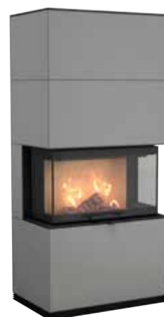
Ci51AN, Artstone Naturale, 345 kg