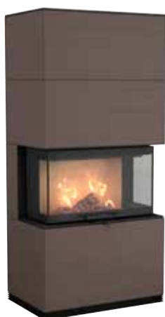
Ci51S, Arenaria, 375 kg